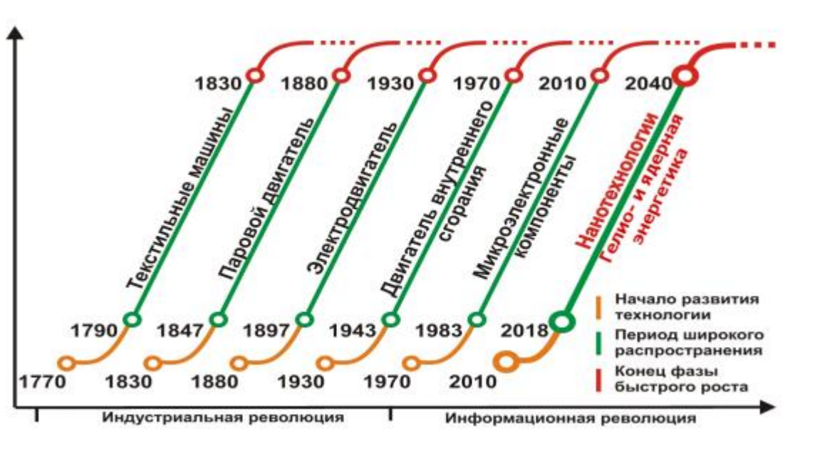
Рис. 2. Смена технологических укладов в ходе современного экономического развития 4 .

На основе анализа кризисных явлений в мировой экономике Глазьев С.Ю. выделяет шесть этапов ее развития. Он не дает им конкретные названия, но выделяет следующие ключевые факторы развития этих этапов: текстильные машины, паровой двигатель, электродвигатель, двигатель внутреннего сгорания, микроэлектронные компоненты, нанотехнологии и клеточные технологии (рис. 2).